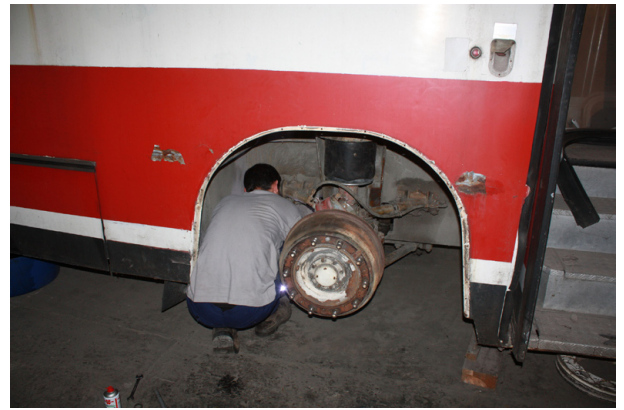
» Sébastien Amato remonte une nouvelle vane de nivellement

Le total des heures consacrées à la rénovation de cet autobus Saviem-Man SG 220 n° 104 s'élève à 54 heures.