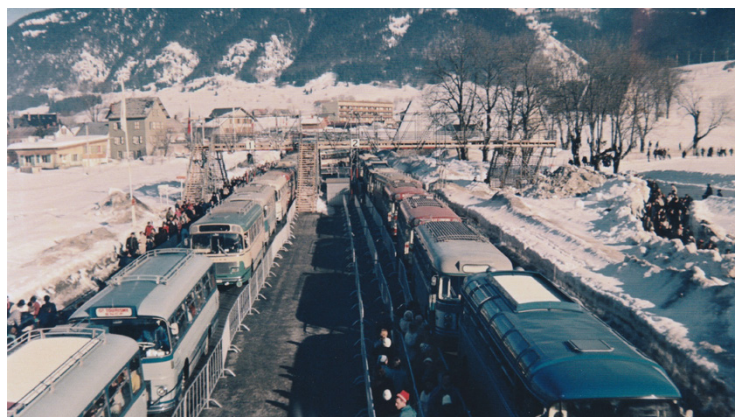
» La gare routière d'Autrans, lors des épreuves de ski nordique et de saut 70 mètres

Par ailleurs, sur 9 de nos 37 véhicules dont des exemplaires identiques participèrent