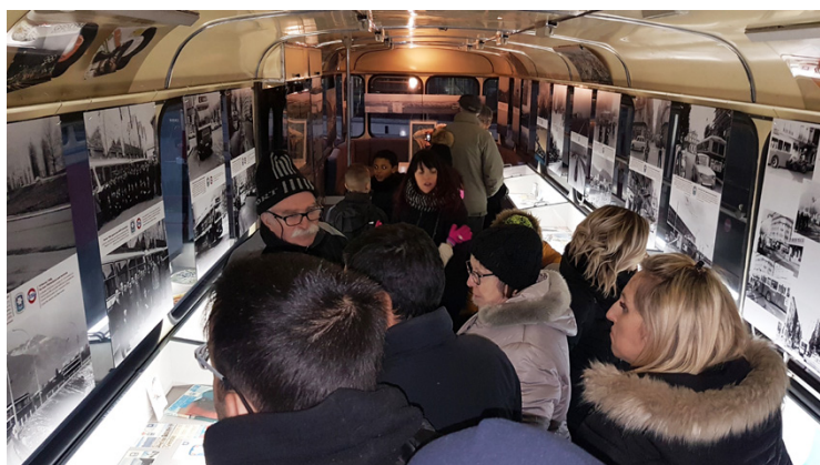
» en bas à droite, une partie de l'équipe de Standard 216 qui a encadré l'exposition pendant les deux week-ends

Nous remercions la SÉMITAG qui a diffusé un visuel faisant la promotion de cette exposition, sur tous les écrans d'information dans les tramways et les autobus (en bas, à gauche).